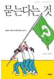
묻는다는 것 정준희 지음 | 너머학교