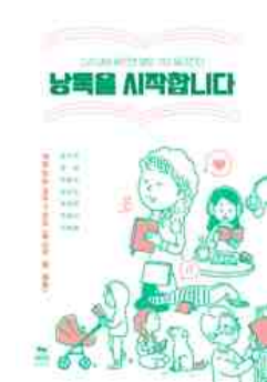
낭독을 시작합니다 문선희 외 6인 지음 | 페이퍼타이거