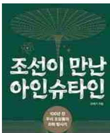
조선이 만난 아인슈타인 민태기 지음 | 위즈덤하우스