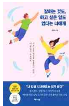
잘하는 것도, 하고 싶은 일도 없다는 너에게 최영숙 지음 | 미디어숲