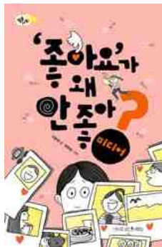
'좋아요'가 왜 안 좋아? 구본권 지음 | 나무를 심는 사람들