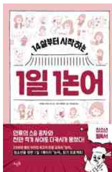
14살부터 시작하는 1일 1노어 사이토 다카시 지음 | 뜨인돌