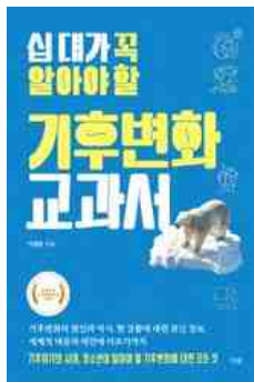
십 대가 꼭 알아야 할 기후변화 교과서