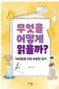
무엇을 어떻게 읽을까? 김남미 지음 | 마리박스