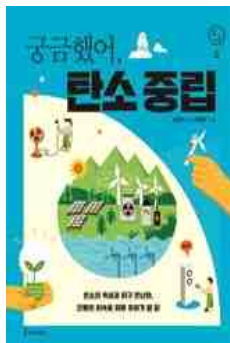
궁금했어, 탄소 중립