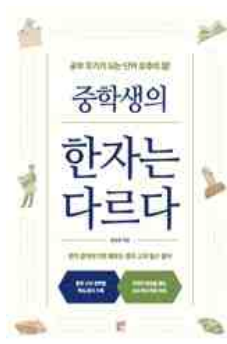
중학생의 한자는 다르다 권승호 지음 | 블루무스