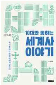
10대와 통하는 세계사 이야기 손석춘 지음 | 철수와영희