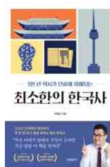
최소한의 한국사 최태성 지음 | 프론티어