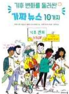
기후 변화를 둘러싼 가짜 뉴스 10가지