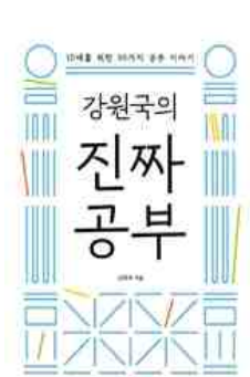
강원국의 진짜 공부 강원국 지음 | 창비교육