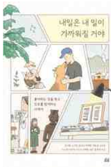
내일은 내 일이 가까워질 거야 김시원 외 지음 | 휴머니스트