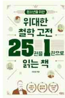
청소년을 위한 위대한 철학 고전 25권을 1권으로 읽는 책 이준형 지음 | 빅픽시