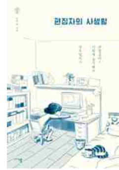
편집자의 사생활 고우리 지음 | 미디어어셈