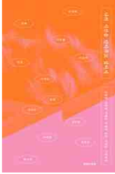
나의 시간을 안아주고 싶어서 김상래 외 지음 | 멜라이트