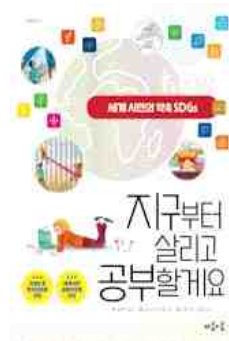
지구부터 살리고 공부할게요