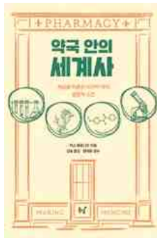
약국 안의 세계사 키스 베로니즈 지음 | 동녘