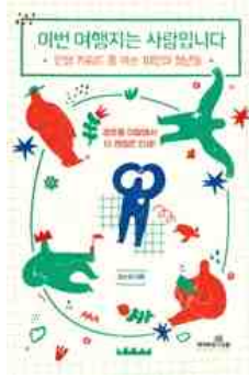
이번 여행지는 사람입니다 김소담 지음 | 책이라는신화