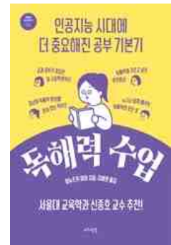
독해력 수업 이누즈카 미와 지음 | 메멘토